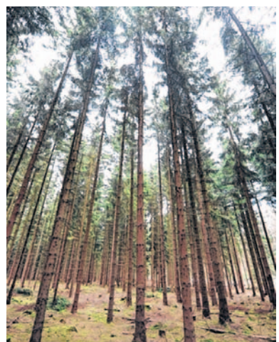
Wegen der anhaltenden Trockenheit steigt die Waldbrandgefahr.

Informationen zur aktuellen Waldbrandgefahr gibt es unter www.feuerwehr-weinheim.de/warnungen.html im Internet. wes